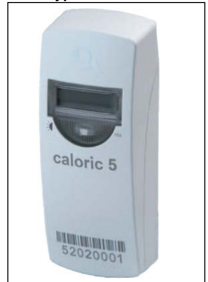
Q caloric5 ® Typ HCA5x

Um Ihnen die Möglichkeit zu geben, aus den ständig wechselnden Anzeigeschritten Ihre Messwerte zur Kontrolle selbst ablesen zu können, orientieren Sie sich bitte am nachfolgenden Anzeigeschema.